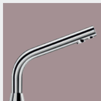
Torneiras para Locais Públicos