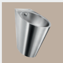
Sanitários em Aço Inoxidável