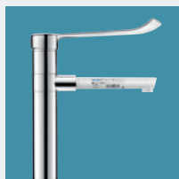
Torneiras para Estabelecimentos Hospitalares e de Cuidados de Saúde