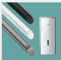
Acessibilidade e Autonomia Acessórios de Higiene