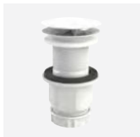
Versão em branco