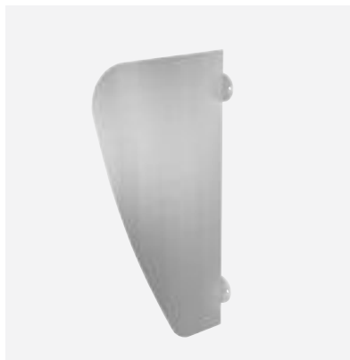
Séparateur urinoir AZA Réf. DELABIE : 100620

Illustrations disponibles sur notre site internet delabie.fr , rubrique Presse