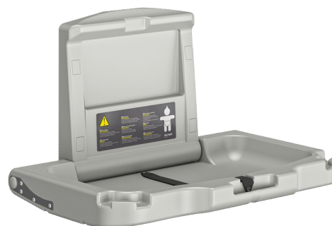
Table à langer murale